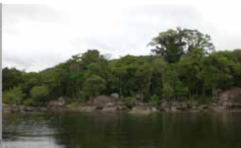
Área de proteção Ambiental em Guaraqueçaba, propriedade da FMO