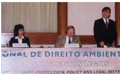
Mesa diretora do Congresso Internacional de Direito Ambiental na Sede Central do Brasil

O segundo é um seminário que aos poucos está tornando-se conhecido pelo meio acadêmico.