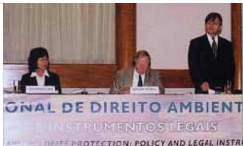
Mesa diretora do Congresso Internacional de Direito Ambiental na Sede Central do Brasil

primeiro, já referência no setor é uma parceria entre a FMO e o Instituto “ O Direito por um Planeta Verde”.