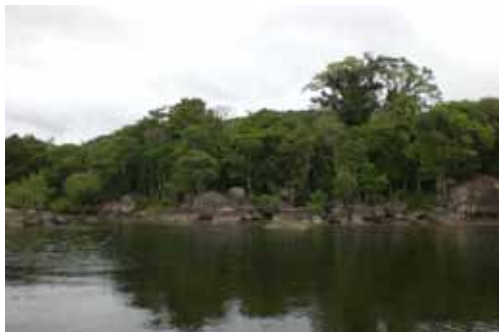
Área de proteção Ambiental em Guaraqueçaba, propriedade da FMO

áreas de consultoria e assessoria científicas orientada e desenvolvendo os métodos da agricultura natural.